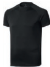
99 black 1 3 5