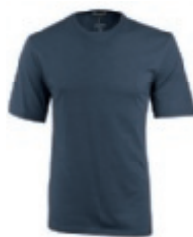
49 navy 1 2 3 4