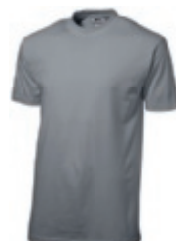
90 grey ♂♀ 1 2 3