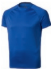
44 blue 1 3 5