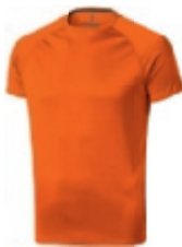
33 orange 1 3 4 5