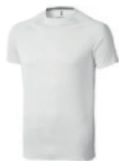
01 white 1 3 4 5