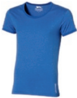
53 heather blue 1 2 3