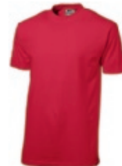
28 darkred ♂♀ 1 2 3