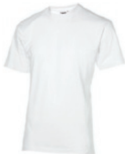
01 white 1 2 3