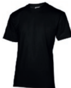
99 black 1 2 3