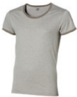
94 heather grey** 1 2 3

Modèle femme avec encolure large et coupe ajustée pour une silhouette élégante et féminine.