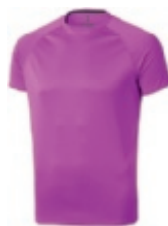
20 neon pink 1 3 5