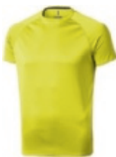
14 neon yellow 1 3 5