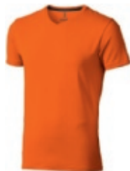
33 orange 1 2 3