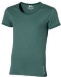
74 heather green 1 2 3