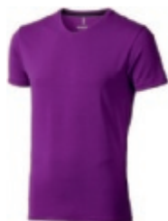
38 plum 1 2 3