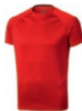
25 red 1 3 5