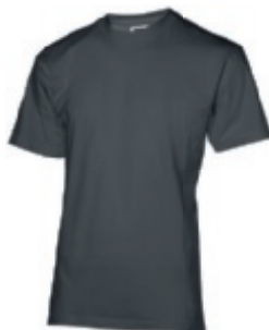
93 darkgrey 1 2 3