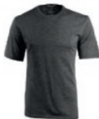
98 heather charcoal 1 2 3 4