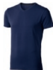
49 navy 1 2 3