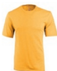
15 heather amber 1 2 3 4