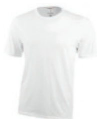
01 white 1 2 3 4