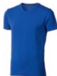
44 blue 1 2 3