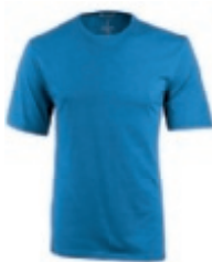
53 heather blue 1 2 3 4