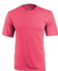
27 heather red 1 2 3 4