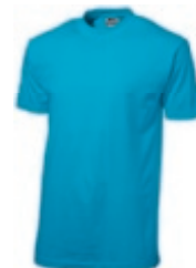
51 aqua ♂♀ 1 2 3