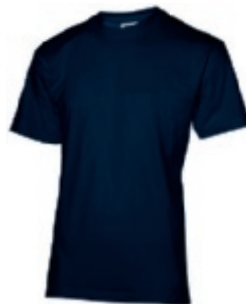
49 navy 1 2 3