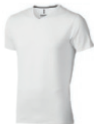
01 white 1 2 3