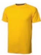
10 yellow 1 3 4 5