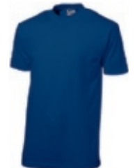
47classicroyalblue ♂♀ 1 2 3