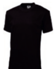
99 black ♂♀ 1 2 3