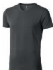
95 anthracite 1 2 3