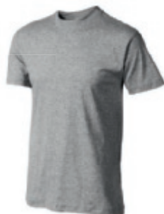
96 greymelange* 1 2 3