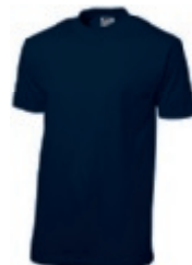
49 navy ♂♀ 1 2 3