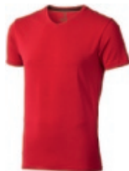
25 red 1 2 3