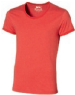
27 heather red 1 2 3