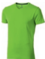
68 apple green 1 2 3