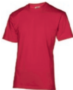
28 darkred 1 2 3