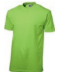
72 applegreen ♂♀ 1 2 3