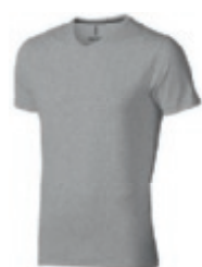
96 grey melange 1 2 3