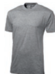
96 sportgrey ♂♀** 1 2 3