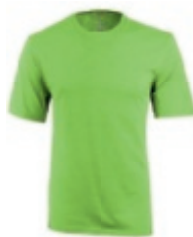
73 heather apple 1 2 3 4