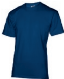
47 classicroyalblue 1 2 3