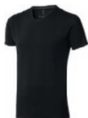
99 black 1 2 3