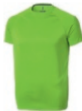
68 apple green 1 3 4 5