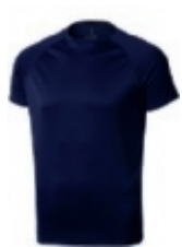
49 navy 1 3 5