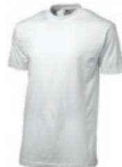
01 white ♂♀ 1 2 3