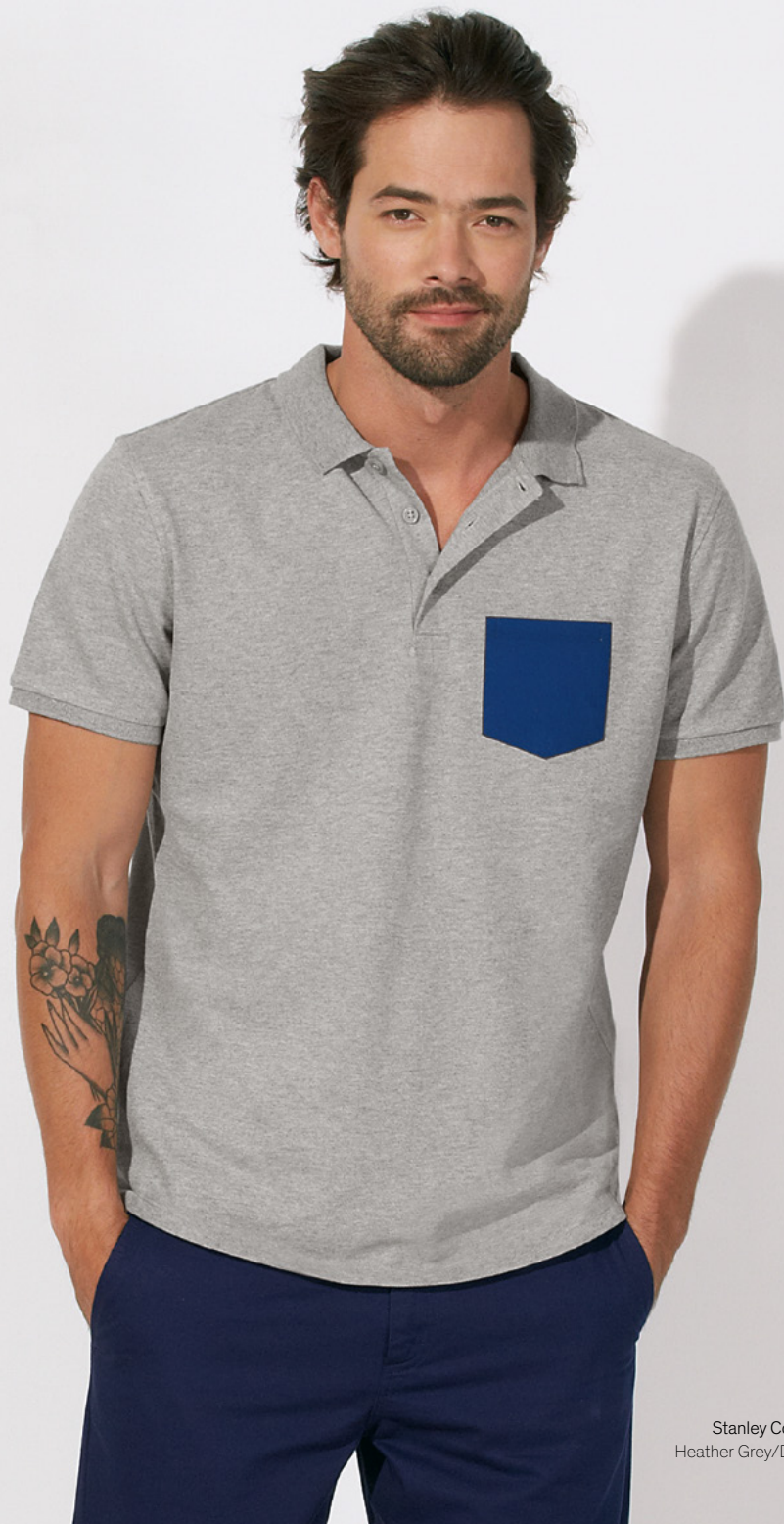
Stanley Competes Pocket Heather Grey/Deep Royal Blue