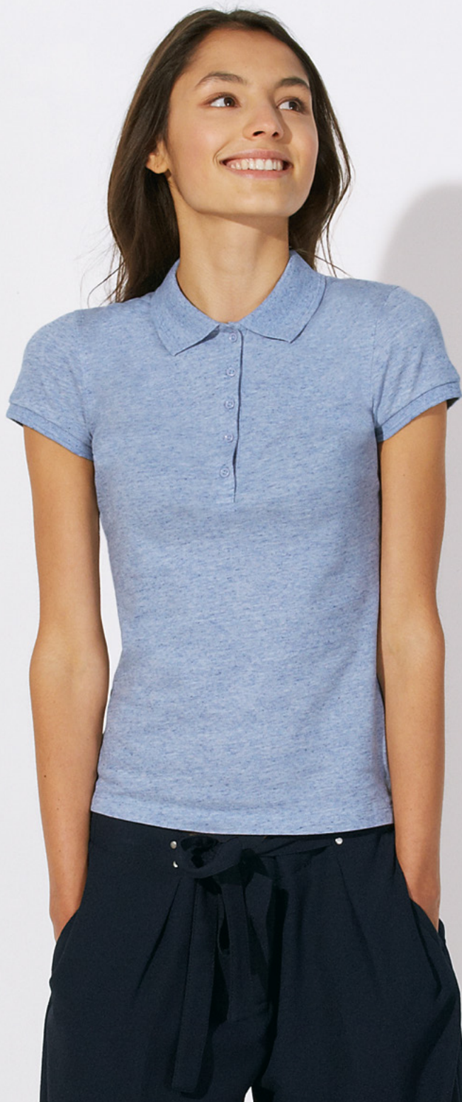
Stella Plays Cream Heather Blue