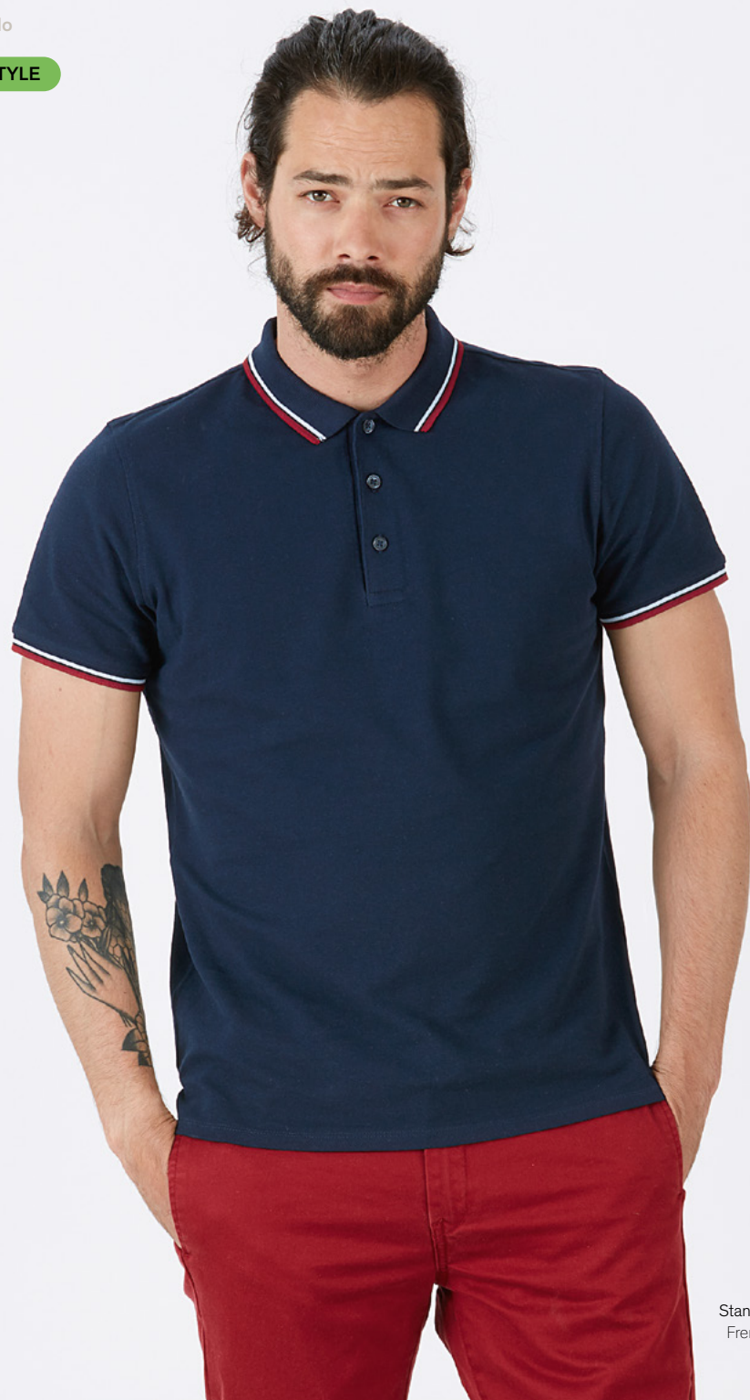
Stanley Competes Tipped French Navy/White/Red