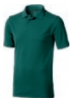
60 forest ① ② ③ ⑥