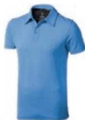
40 light blue-anthracite 1 2 3