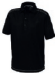
99 black 1 3 5

Piqûres contrastées sur le devant des épaules pour un style tendance.