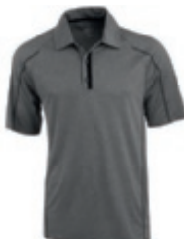
98 heather charcoal ① ② ③ ⑤