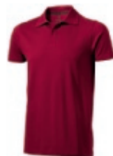
24 burgundy ① ② ③ ⑥