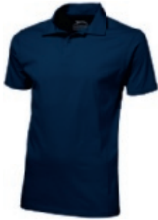
49 navy ① ② ③