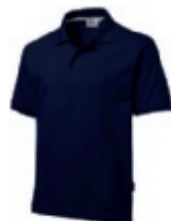
49 navy ♂♀ 1 2 3