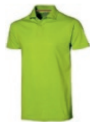
68 applegreen 1 2 3