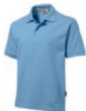
40 lightblue ♂♀ 1 2 3