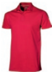
25 red 1 2 3