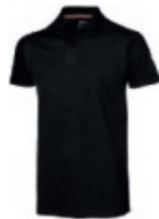
99 black 1 2 3