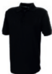
99 black 1 2 3