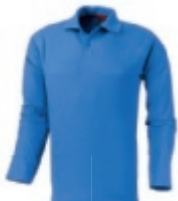
42 skybluc 1 2 3