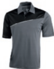
92 steel grey-black