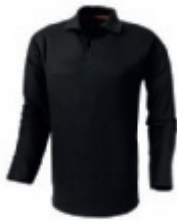
99 black 1 2 3