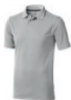
96 grey melange** ① ② ③