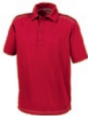
28 darkred 1 3 5