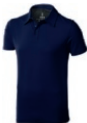
49 navy-anthracite 1 2 3