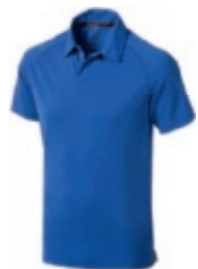
44 blue 1 2 3 5