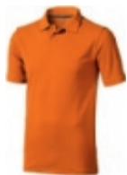
33 orange ① ② ③