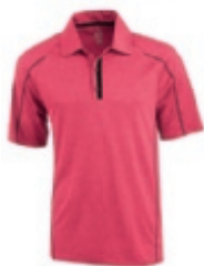
27 heather red ① ② ③ ⑤