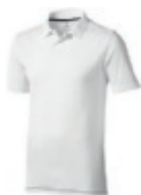
03 white-navy ① ② ③