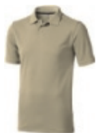
05 khaki ① ② ③