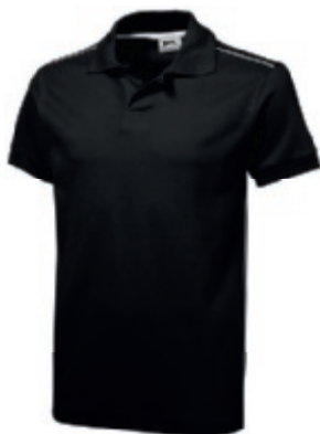
99 black-white ① ② ③