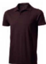
86 chocolate brown ① ② ③ ⑥