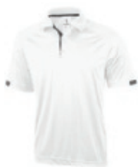
01 white 1 3 5