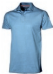
40 lightblue 1 2 3