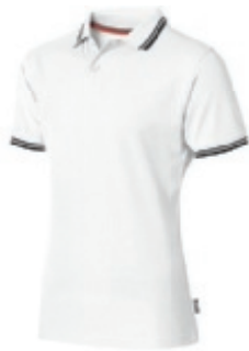
01 white 1 2 3