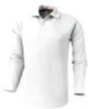
01 white 1 2 3