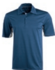
46 denim 1 3 5 6