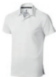
01 white 1 2 3 4 5