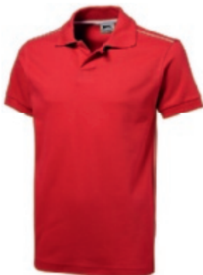
25 red-white ① ② ③