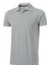
96 grey melange** ① ② ③