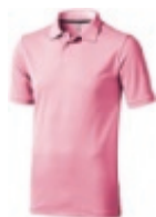
23 light pink ① ② ③