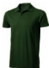
70 army green ① ② ③ ⑥