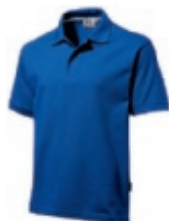
47 classicroyalblue ♂♀ 1 2 3