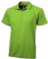
68 applegreen ① ③ ④ ⑤