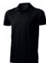
99 black ① ② ③