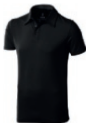
95 anthracite-black 1 2 3