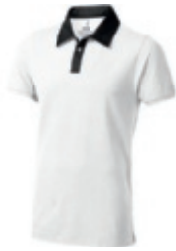
01 white-anthracite 1 2 3