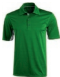
67 green 1 3 5 6