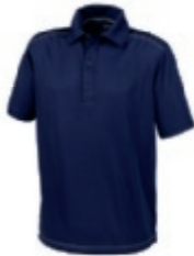
49 navy 1 3 5