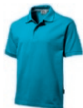
51 aqua ♂♀ 1 2 3