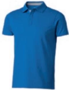
42 skyblue-grey ① ② ③