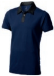
49 navy-anthracite 1 2 3