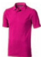
21 pink ① ② ③