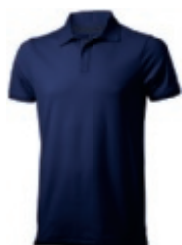
49 navy 1 2 3