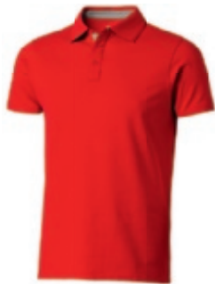
25 red-grey ① ② ③