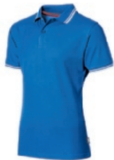
42 skyblue 1 2 3