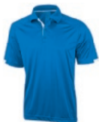
44 blue 1 3 5