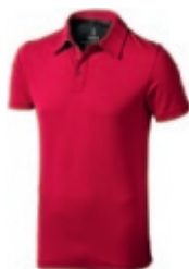
25 red-anthracite 1 2 3