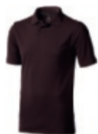
86 chocolate brown ① ② ③