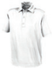
01 white 1 3 4 5