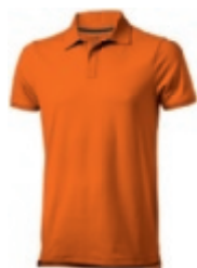
33 orange 1 2 3