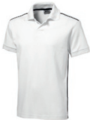
01 white-navy ① ② ③