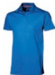
42 skyblue 1 2 3