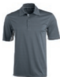
92 steel grey 1 3 5 6