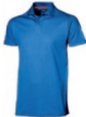
47 classicroyalblue 1 2 3