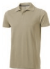
05 khaki ① ② ③