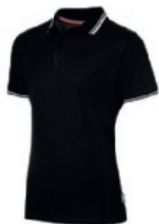
99 black 1 2 3