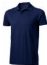
49 navy ① ② ③ ⑥