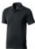
95 anthracite ① ② ③