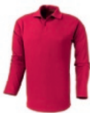
25 red 1 2 3