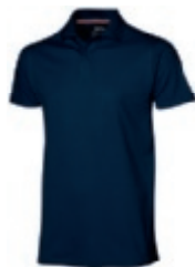
49 navy 1 2 3