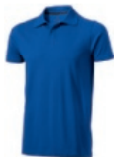
44 blue ① ② ③ ⑥