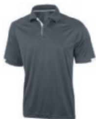
92 steel grey 1 3 5