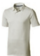
90 light grey ① ② ③