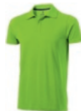
68 apple green ① ② ③