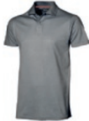
90 grey 1 2 3