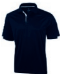
49 navy 1 3 5