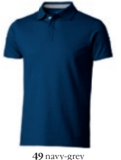
49 navy-grey ① ② ③