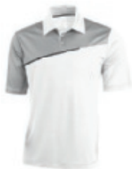
01 white-light grey