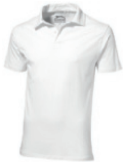
01 white ① ② ③