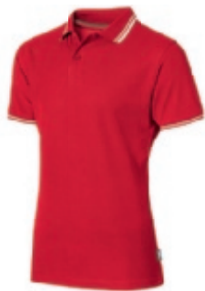
25 red 1 2 3