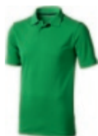
69 fern green ① ② ③