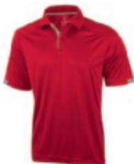
25 red 1 3 5