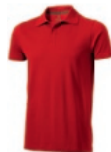
25 red ① ② ③