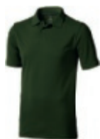
70 army green ① ② ③