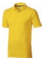
10 yellow ① ② ③