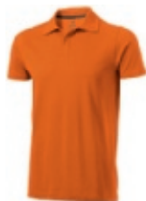
33 orange ① ② ③