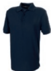
49 navy 1 2 3