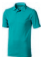
51 aqua ① ② ③