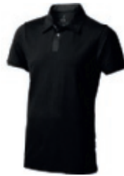
99 black-anthracite 1 2 3