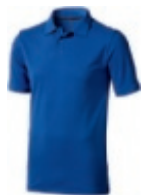
44 blue ① ② ③ ⑥