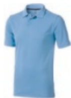
40 light blue ① ② ③