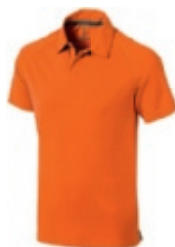
33 orange 1 2 3 4 5