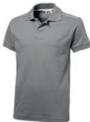
90 grey-white ① ② ③