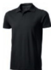
95 anthracite ① ② ③ ⑥