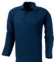
49 navy 1 2 3