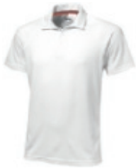
01 white ① ③ ④