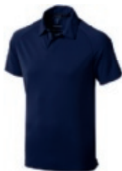
49 navy 1 2 3 5