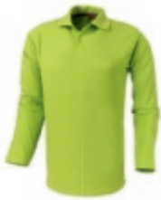
68 applegreen 1 2 3