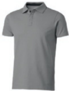
90 grey-black ① ② ③