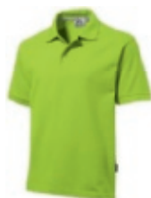
72 applegreen ♂♀ 1 2 3