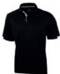
99 black 1 3 5