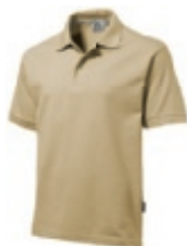
12 khaki ♂♀ 1 2 3