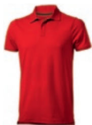
25 red 1 2 3