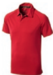
25 red 1 2 3 5