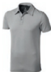
96 grey melange-anthracite** 1 2 3