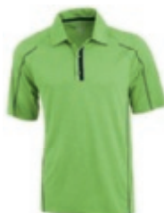
73 heather apple ① ② ③ ⑤