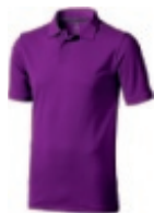
38 plum ① ② ③ ⑥