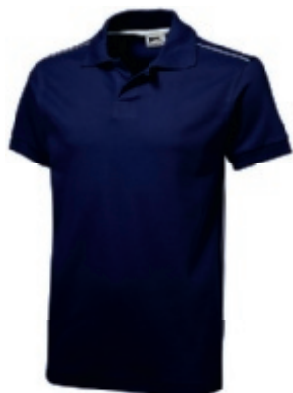
49 navy-white ① ② ③