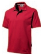
28 darkred ♂♀ 1 2 3