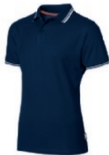
49 navy 1 2 3