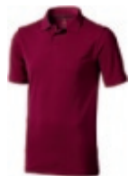
24 burgundy ① ② ③