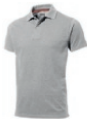
95 greymelange* 1 2 3