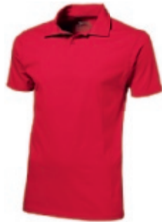
25 red ① ② ③