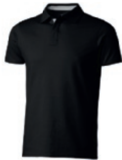
99 black-grey ① ② ③