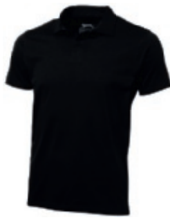
99 black ① ② ③