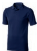
49 navy ① ② ③