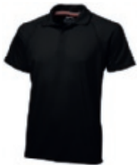
99 black ① ③ ⑤