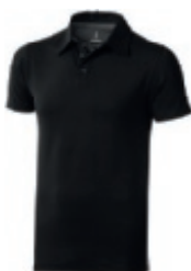
99 black-anthracite 1 2 3