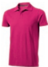
21 pink 1 2 3