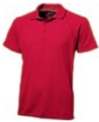
25 red ① ③ ⑤