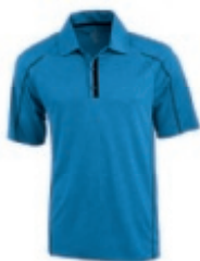
53 heather blue ① ② ③ ⑤