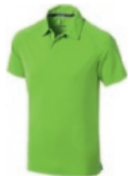
68 apple green 1 2 3 4 5