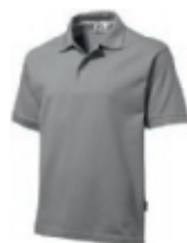
90 grey ♂♀ 1 2 3