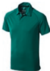
60 forest 1 2 3 5