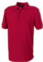
25 red 1 2 3