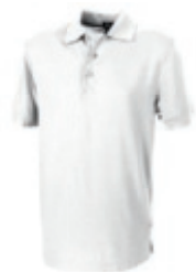
01 white 1 2 3