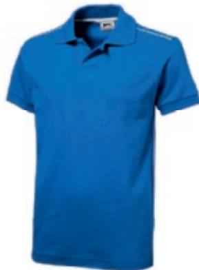
42 skyblue-white ① ② ③