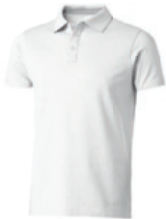
01 white-grey ① ② ③