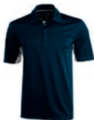
49 navy 1 3 5 6