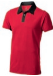
25 red-anthracite 1 2 3