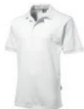
01 white ♂♀ 1 2 3