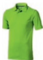
68 apple green ① ② ③