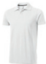
01 white ① ② ③