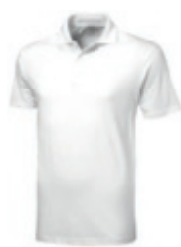
01 white 1 2 3