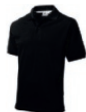
99 black ♂♀ 1 2 3