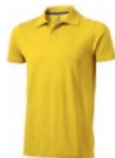
10 yellow ① ② ③