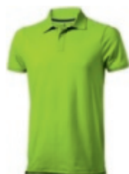
68 apple green 1 2 3