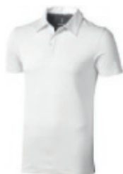
01 white-anthracite 1 2 3