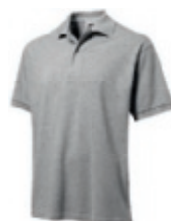
96 sportgrey ♂♀** 1 2 3