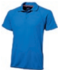
42 skyblue ① ③ ⑤