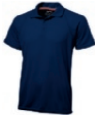
49 navy ① ③ ⑤