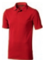
25 red ① ② ③