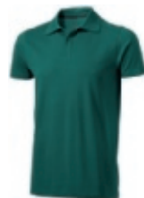
60 forest ① ② ③ ⑥