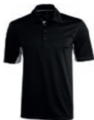
99 black 1 3 5 6